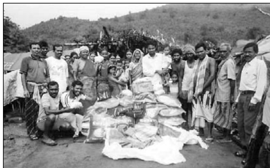
Pomoc CSI v Indii

Dva roky po brutálních útocích na křesťany ve svazovém státě Orissa mnoho těžce postižených nedostalo žádnou pomoc. CSI utečence navštívilo a přineslo jim svoji pomocí naději a povzbuzení.