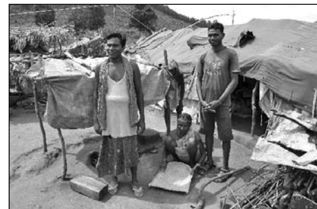
Utečenci před stanem