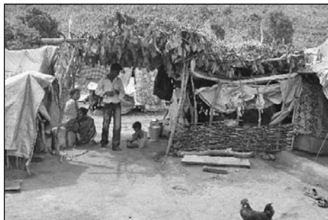
A tak to v kandhamaském táboře vypadá

mzdu, což je úplné minimum, sotva k přežití. Když jsme okrese Kandhamal projížděli, upozorňovali nás naši indiští průvodci, že jsme nápadní a nemusí se nám podařit setkat. Situace je stále napjatá. Do této oblasti přijíždějí cizinci jen vzácně a když, tak jsou to křesťané. V celém svazovém státě Orissa bylo tehdy zbořeno 400 kostelů a asi 5600 domů. 54000 křesťanů muselo uprchnout ze svých domovů. Doposud je jich většina ve 14 uprchlických táborech.