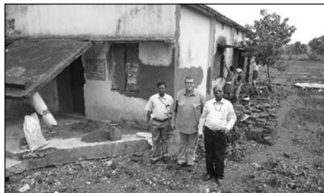
Kostely jsou obvykle prostínké, ale pohled na zbořený kostel je smutný

Jak vůbec došlo k takovému násilí a pogromům koncem srpna 2008? Stav mezi křesťany a hindu byl plný napětí už delší dobu. Je to velký rozdíl, když přijedete ze špinavé a páchnoucí hindu ulice do křesťanské části. Křesťané jsou zdatní obchodníci a podnikatelé a představují tedy velkou konkurenci. Hindu v nich vidí nebezpečí. V oblasti však působí také velmi aktivní skupiny maoistů. Chtějí nastolit extrémní