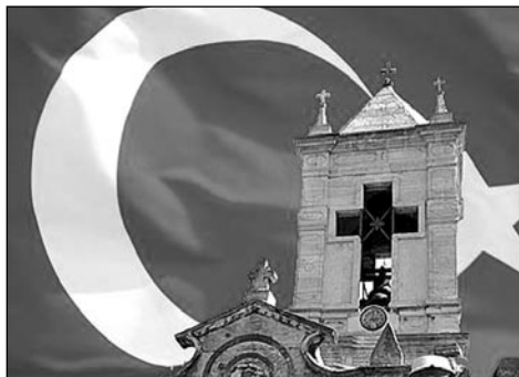
Kříž a půlměsíc se stále hůře snášejí

V Turecku žije méně než půl procenta křesťanů. Ve výkonu své víry jsou však ze všech stran omezováni. Úřední šikany a diskriminace jsou běžné.