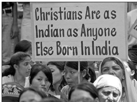
Křesťané protestují proti diskriminaci. Na transparentu je nápis: „Křesťané jsou Indové jako každý narozený v Indii“.