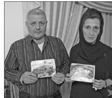
Křesťanští manželé, kterým teroristé zabili dva syny.

Počet křesťanů v Iráku v těchto měsících velmi rychle klesá. Snahu o vymýcení sym-