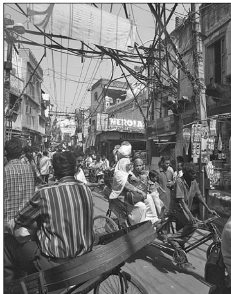
Život v indickém městě (Peter Schäublin)

Křesťanství je pro mnohé hinduisty spojeno s dřívější britskou koloniální nadvládou.