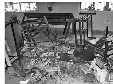
Kláster v Balligudě byl zničen hinduskými extrémisty. (DB)

lidí se ocitlo bez domova a hledalo útočiště v lesích. Policie byla sice přímo na místě, ale nezasáhla.