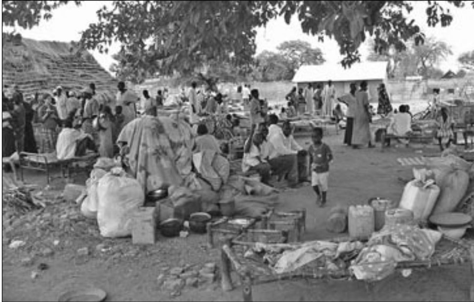
Navrátilci z Obejdu v Maluakonu.

ti bylo navázání pevných kontaktů s vůdci a představiteli dinkských komunit, které se staly terčem nájezdů na otroky. Byla také vytvořena síť súdánských spolupracovníků. Vysvobození otroků dříve probíhalo vý-