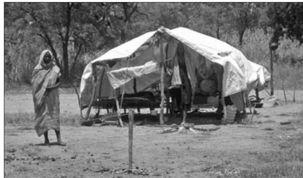
Uprchlíci z Dárfúru přečkávají v Jižním Súdánu v nutných podmínkách. Dárfúrská žena v jihosúdánském Jaac. (CSI)

v Jižním Súdánu částečně zlepšila. Určité zklidnění a příznivější klima pro návrat uprchlíků přinesla mírová dohoda z roku 2005. Naděje jihosúdánských otroků držných na severu je tak o něco málo větší, než byla v průběhu občanské války. Organizacím pro lidská práva se podařilo poukázat na problém otroctví v Súdánu a na základě rozhovorů s osvobozenými získat důležitá svědectví a dokumentaci. V reakci na tyto zprávy došlo hlavně ve Spojených státech k vyvinutí politického tlaku na súdánský režim.