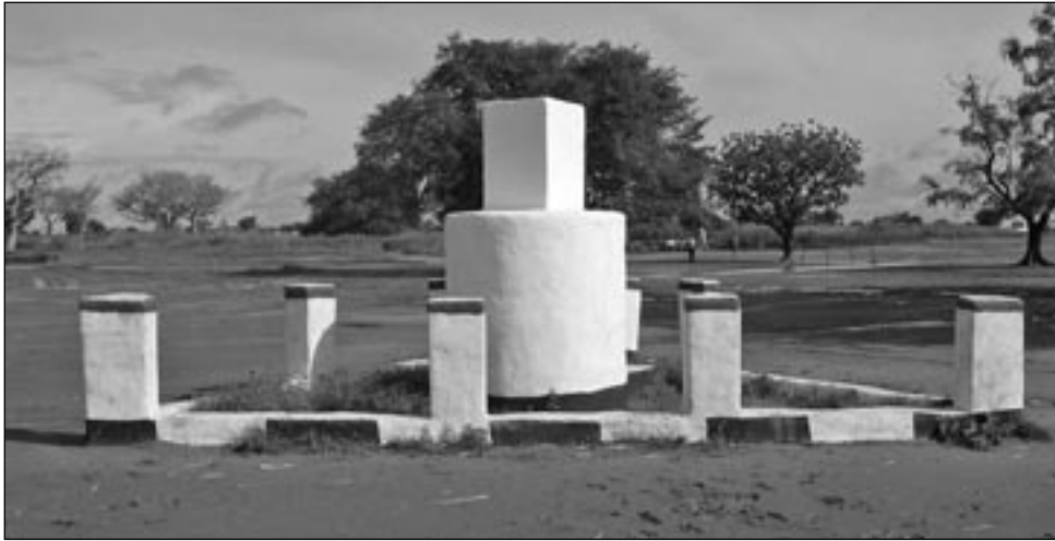
Válečný památník v Maluakonu (CSI)

CSI využívá zkušenosti z působení přímo v Súdánu, konkrétně v Bahr al Ghazalu. Problémem otroctví se pracovníci CSI začali zabývat v polovině devadesátých let minulého století. Hlavním předpokladem činnos-