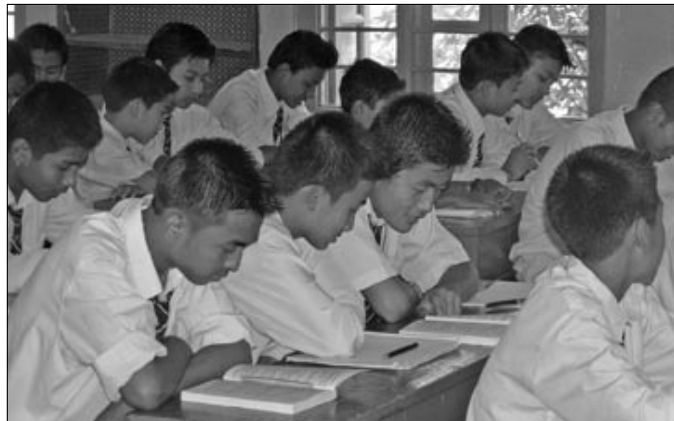
Indické školy jsou ve srovnání s našimi přeplněny!

Vypuštění ostatních předmětů vychází z principu, že v základní škole se získávají nástroje potřebné pro další vzdělávání – jazyky a aritmetika. Ostatní předměty se probírají i proto, aby se zamezilo nudnému koloběhu hodin základních předmětů. Proto jsme také zařadili trochu zeměpisu, při tom se ale učila zároveň angličtina. Zvládnutí nástrojů pro další učení postačuje pro zařazení dětí do vyšších tříd škol.