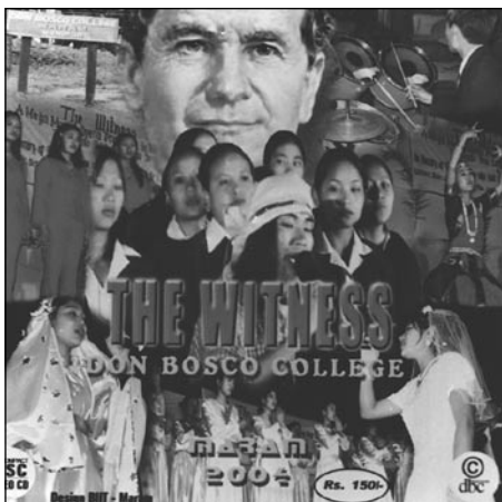
The Witness (Svěděk) – obálka k CD

Pokud byste o filmové CD, které jsme doplnili českými titulky, měli zájem, napište nám. Společně s dalším zpravodajem ho obdržíte na Vámi uvedené adrese.