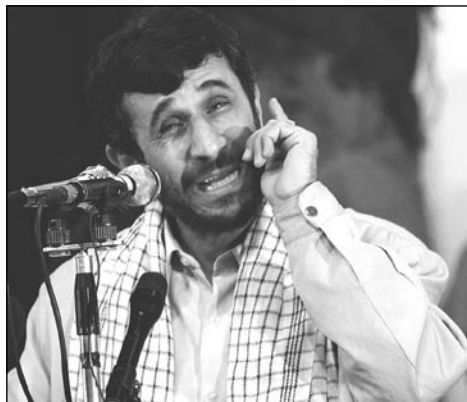
Íránský prezident Mahmúd Ahmadínežád

V říjnu 2005 prohlásil iránský prezident Mahmúd Ahmadínežád, že chce odstranit Izrael z mapy světa. „Utopíme Izrael v krvi. Ta poskvrna musí zmizet!“ Má to být nářážka na možnou iránskou atomovou bombu, jejíž dokončení předpovídají znalci na tento rok? Potom si hlava státu stěžovala na evropské zákonodárství, které trestá popírání holocaustu