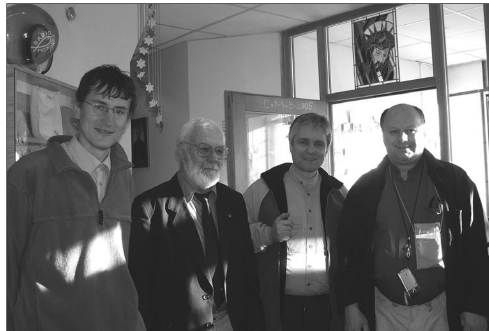
Česká výprava při cestě do Indie.

kusech. Ve zpravodajích byly uvedeny také protestní listky (celkem 5 ks), které se po vystřižení, podepsání a nalepení známky posílají politikům do zemí, kde jsou pronásledováni naši bratři a sestry v Kristu.