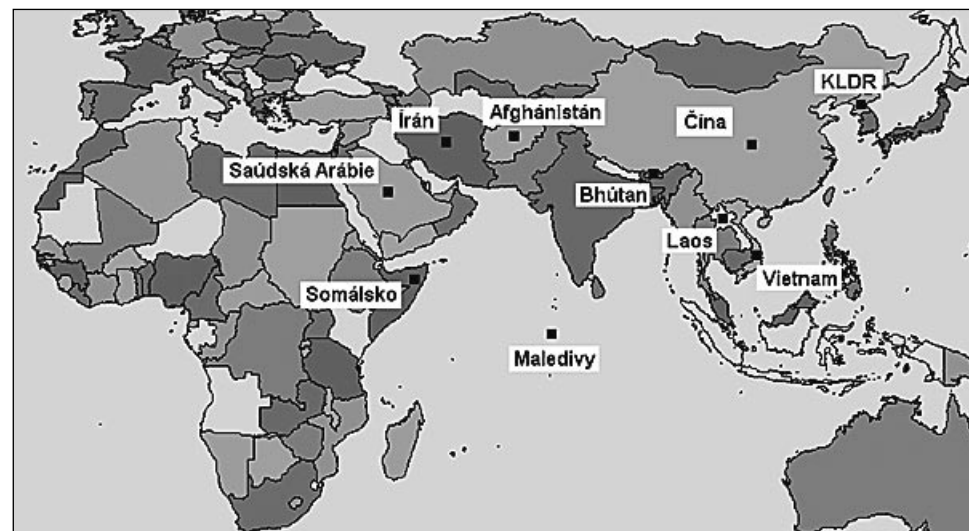
Na mapě jsou země, kde jsou křesťané nejvíce pronásledováni.

Žádná země na světě nedosahuje takového stupně pronásledování křesťanů jako Severní Korea . Ve stalinismem ovlivněné zemi se nachází mnoho křesťanů v koncent-