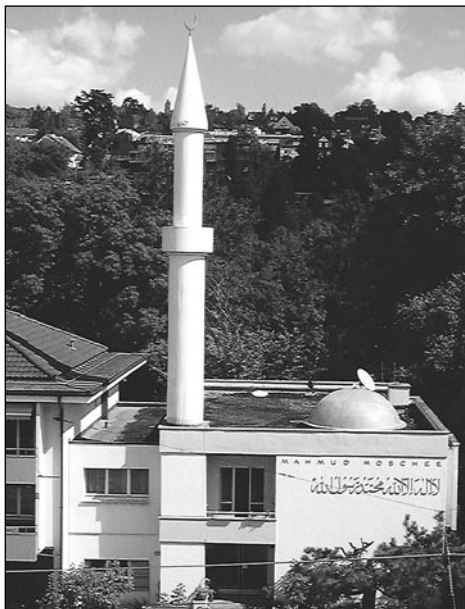
Mešity doprovázejí růst muslimského náboženství v Evropě.

K tomu přistupuje ještě tvorba tak zvaných paralelních struktur. Jedná se o právní prostor, kde neplatí zákony země, ale muslimské zákony. Podle časopisu Factum (9/2005) je ve Francii mezi přistěhovalci ze severní Afriky 20 až 30 tisíc polygamních rodin s průměrně deseti dětmi. Stát tyto poměry toleruje a platí